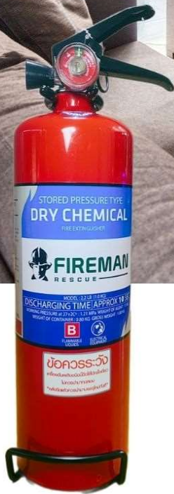
Model: 2 lbs 1A-2B