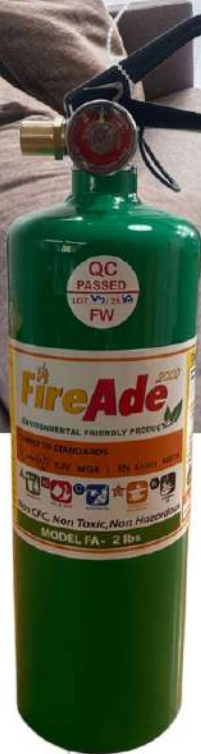
Model: 2 lbs 1A-2B